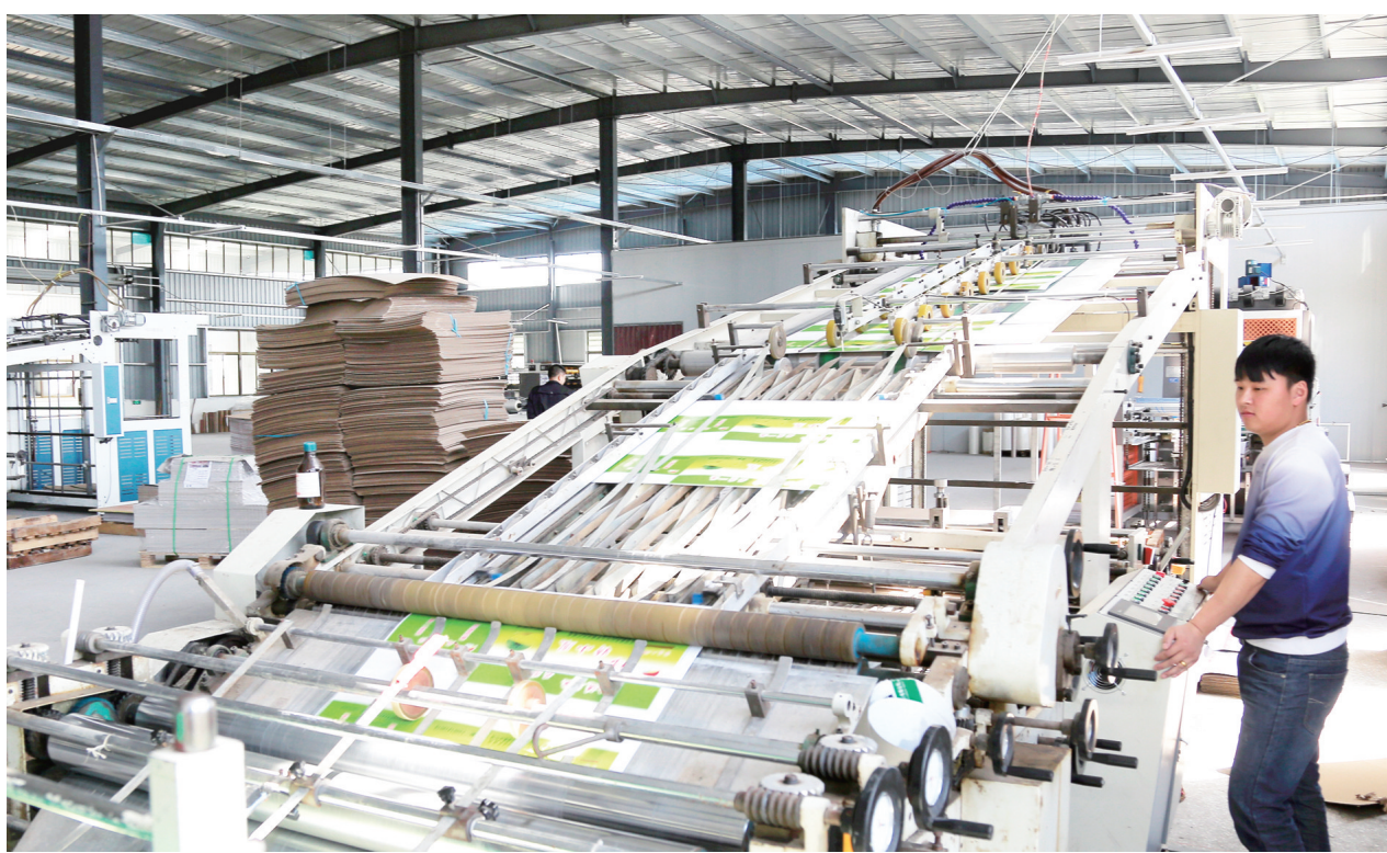
4月19日,建桥包装制品有限公司生产车间内工人正操作贴面机生产西瓜包装纸箱。今年以来,来自东台的西瓜包装纸箱、特色食品包装纸箱订单源源不断,目前订单已排至6月份。

与此同时,由区全民阅读促进会主办,相关读书组织承办的区中小学生学习“江南有约”征文比赛颁奖典礼在黄海西路图书馆举行。本次活动鼓励青少年参与社会实践,倡导企业助推全民阅读,营造全民阅读的氛围作出了积极的贡献。(图轩)