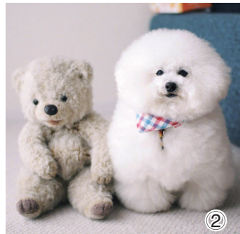
② 真假