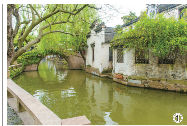
① 怡然