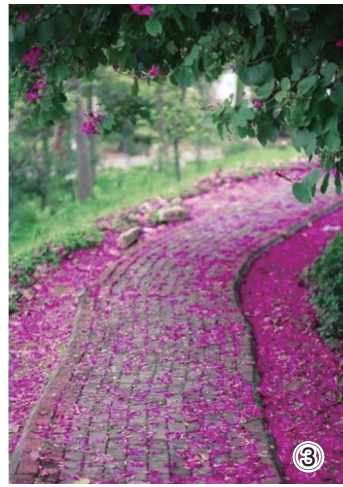
③ 曲径 家国摄