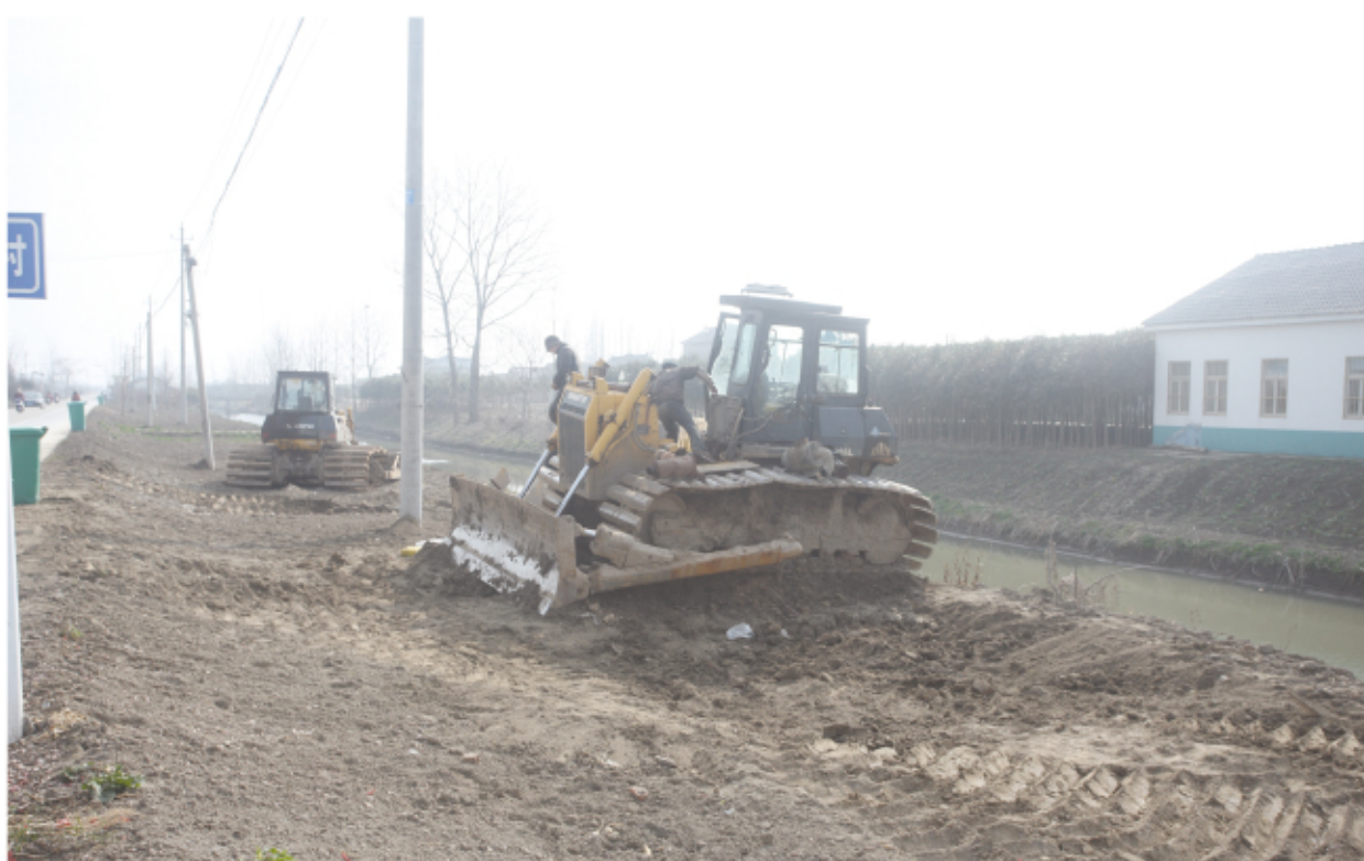
2月24日,西团镇东北片土地整理项目现场,施工人员在紧张施工。据悉,该项目总投资3246万元,通过土地翻耕平整、河沟清淤、农桥建造等,改善群众生活条件,预计4月份竣工。

本报讯 日前,江苏辉丰生物农业股份有限公司主要负责人来到区爱心素食馆,代表公司为素食馆捐赠10万元。这是该公司狠抓经济发展同时积极履行社会责任的一个镜头。 近年来,该公司不断加大环保安全、转型升级、产学研结合力度,全面深入贯彻创新思维、互联网思维、金融思维,着力实现“生产型到创新型、卖产品到卖服务、本土企业到跨国企业”三个转型,向“中国企业500强、年销售额百亿、全球文化15强”的“十三五”规划目标阔步迈进。一路走来,对辉丰而言,既是成长之路,又是慈善之路。该公司自成立以来,便把帮扶弱势群体作为重要的职责,时刻用爱心从事公益、慈善事业。公司于2007年与区慈善总会签订长期捐赠600万元协议,每年定向捐赠30万元,资助贫困大学生20名。截至目前,已累计向社会捐赠2000多万元。(沈春涛 陈晓虎)