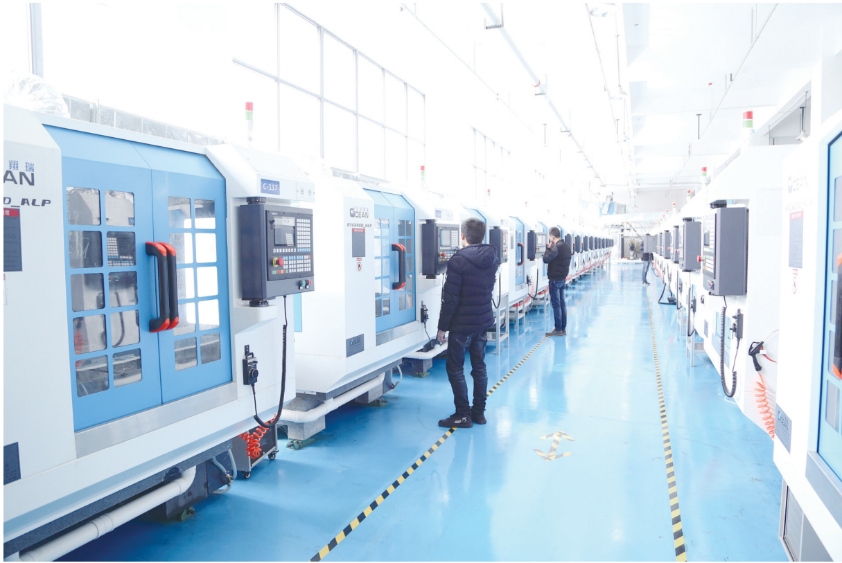
3月5日,江苏视光电有限公司生产车间内,技术工人正在忙碌生产。据悉,该公司自去年投产以来,生产运营平稳,触控显示一体化模组项目建成后,可年产4000万片1—45英寸集成多点电容式触摸屏和LCM显示屏。目前,公司上下正满负荷生产,以满足市场需求。

本报讯 3月5日,大丰浙江商会召开会议,谋求加快发展思路。 近年来,该商会积极响应区委、区政府招商引资发展经济的号召,充分发挥聚人心、搭桥梁、促合作的功能,大力宣传推介大丰投资环境,吸引浙商踊跃来大丰投资创业,助推大丰跨越开发,促进丰浙区域经济合作,取得丰硕成果。商会还成立联建党支部和劳动人事仲裁委员会,获得国家5A级组织评级,各项工作在江苏省浙江商会中名列前茅。 进入新时代,该商会将加强会员的党建意识,认真学习党的十九大精神,努力打造“四好”商会,拟建商会总工会,把企业发展与区委、区政府中心工作紧密联系在一起,做到有所为、有所不为。继续带领广大在丰浙企弘扬浙商精神,传承浙商文化,励精图治谋划事业新发展,克难求进树立新形象,为丰浙两地经济社会发展作出新的更大的贡献。(刘莹莹)