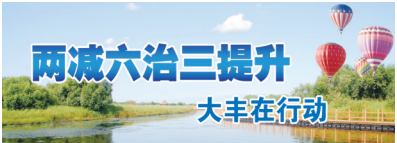
两减六治三提升 大丰在行动

“六治”工作再推进。积极开展垃圾分类宣传工作,按要求完成15套垃圾分类设施投放亭选址与建设工作。加快推进镇村生活垃圾集中转运,大