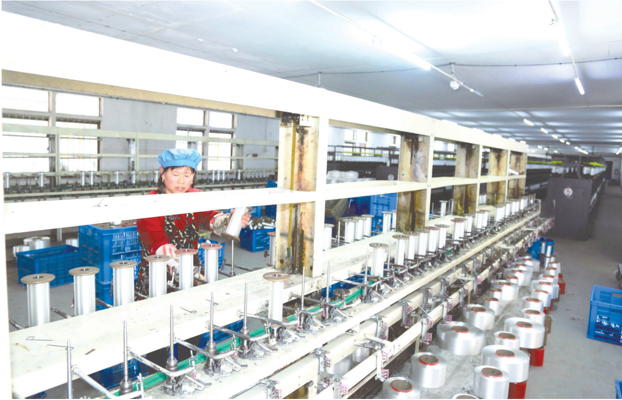
近日,三龙镇嘉龙纺织有限公司生产车间内,工人在操作纺织机生产订单产品。该企业投资1亿元,改造原虹达厂房15000平方米,一期投产纺纱机350台,配套倍捻机等设备50台套,年生产真丝面料2500万米。