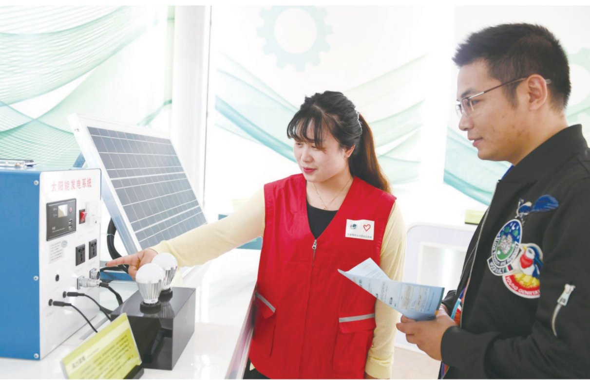
6月6日,区供电公司工作人员向来前办理业务的用户发放环保宣传材料等。连日来,该公司以多种渠道和形式向用户宣传电网环保理念及科学用电知识,深受用户欢迎。