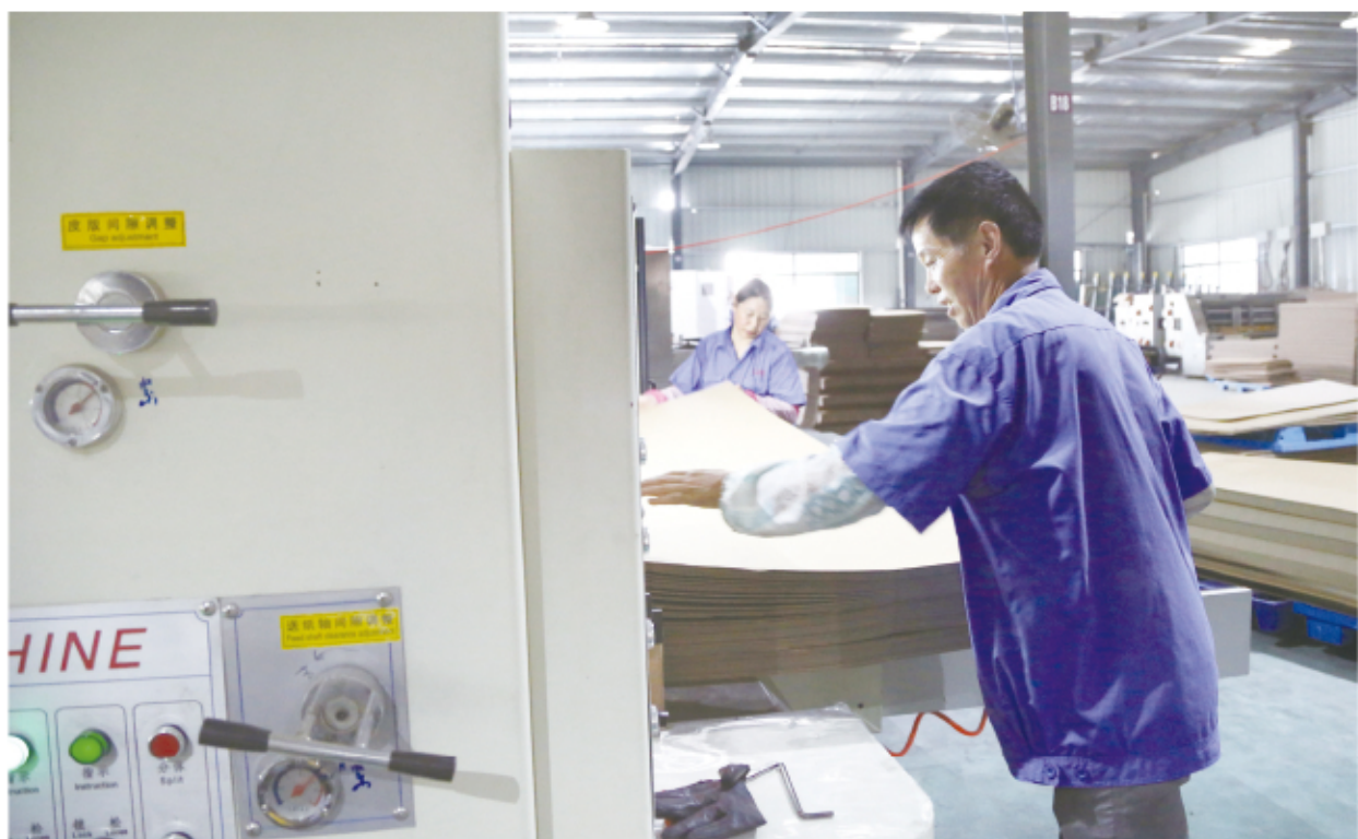
9月17日,盐城乐丰纸业有限公司生产车间内,工人在生产线上忙碌。今年以来,该公司主动出击,加大市场开拓力度,寻求更多的合作伙伴。目前正开足机台,加班加点,力争多产多销,全力冲刺三季度目标任务。

活动邀请了区级文明单位分管负责人、农商行职工代表、职工家属参加,取得了良好的社会效益。(何蕾)