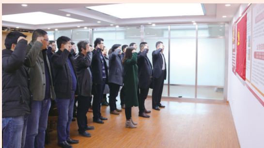
“入党初衷大家谈”主题活动

全区教育系统深入学习贯彻习近平新时代中国特色社会主义思想和全国教育大会精神,推进党的十九大精神进校园、进课堂、进头脑,积极开展多种形式的教育警示活动,持续开展“监督执纪校园行”活动,延伸推进去年全系统范围内进行的“八个专项行动”。2018年,区教育局党委共召开常委会22次,4次组织召开了全区教育系统党风廉政建设警示教育大会,对全区各学校、各单位节日期间作风建设情况进行专项检查8次,明察暗访14次,把党风廉政建设工作融入教育改革发展的各项工作之中,为全区教育事业健康发展提供了有力保证。