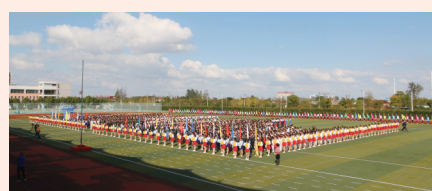
大丰区第九届阳光体育科技艺术节盛大开幕