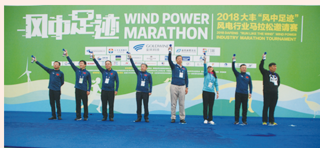
2018大丰“风中足迹”风电行业马拉松邀请赛

11月11日,2018大丰“风中足迹”风电行业马拉松邀请赛圆满收官,本次赛事为国内风电行业内的首个马拉松赛事,以“绿色、环保、健康”为主题,共设置3个组别——半程马拉松(21.0975公里)、健康跑(10.5公里)和迷你跑(3公里),共吸引了4200余名跑友报名,地域跨度从新疆跨越至北京,甚至有风电行业驻海外的员工特地回国支持“自己的比赛”。