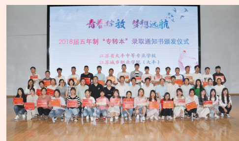
2018届五年制高职“专转本”录取通知书颁发仪式

我区全民学习、终身学习工作取得显著成效。2018年,全区建成全国“乡村振兴研学基地”2个、全国“优秀成人继续教育院校(培训机构)”1个、全国“城乡社区教育特色学校”1个、全国“优秀学习型村居”1个、江苏省“改革发展40周年40佳社教单位”2个。