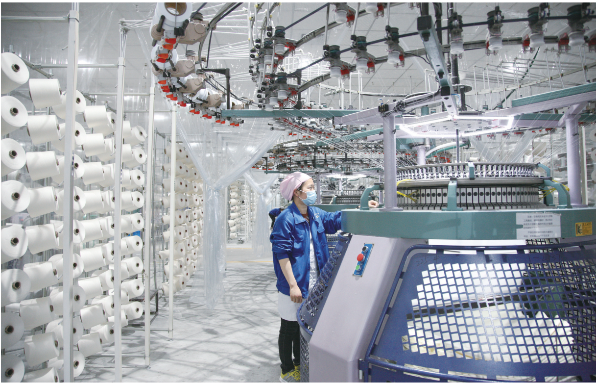
5月4日,上海三枪(集团)江苏纺织有限公司生产车间内,工人在赶制订单产品。据悉,三枪高档针织面料加工项目总投资2.6亿元,专业从事高档针织面料的研发、生产、染整、加工及测试,具有良好的市场前景及较高的产品附加值,截至目前公司已完成开票销售7356万元。

树牢学习之心。学习新思想,坚持正确方向。重点学习习总书记关于工人阶级和工会工作的重要论述,做到常学常新、常思常明、常践常得、常悟常进。学习工会业务知识,打牢自身业务理论基础。积极参加市、区总工会组织的业务培训,挤出时间自学业务书籍,更新知识储备,勤修专业本领,争做工作中的“政策通”“活字典”“多面手”。树牢服务之心。带着对职工群众的服务之心,身体力行地为职工群众谋利益、办实事。以饱满的工作热情、昂扬向上的精神状态对待工作中的每一天,尽心尽力做好每件小事,用心、用情服务。树牢敬畏之心。工会干部要具备大公无私的境界、忠诚老实的品格、健康高雅的情趣、刚正不阿的气节,工作中坚持做到“有所为,有所不为”,时刻保持头脑清醒,真正筑牢拒腐防变的防线,抵住诱惑,心怀敬畏,努力工作。(范蕴蕾)