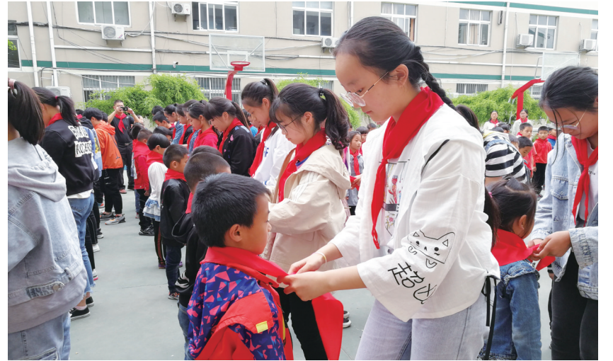
日前,新丰镇中心小学举行一年级新生中国少年先锋队入队仪式,184名小朋友戴上了鲜艳的红领巾。整个入队仪式规范且隆重,不仅让孩子们受到了爱国主义教育,同时也让他们认识到自己肩负的使命,增添了作为少先队员的荣誉感和自豪感。