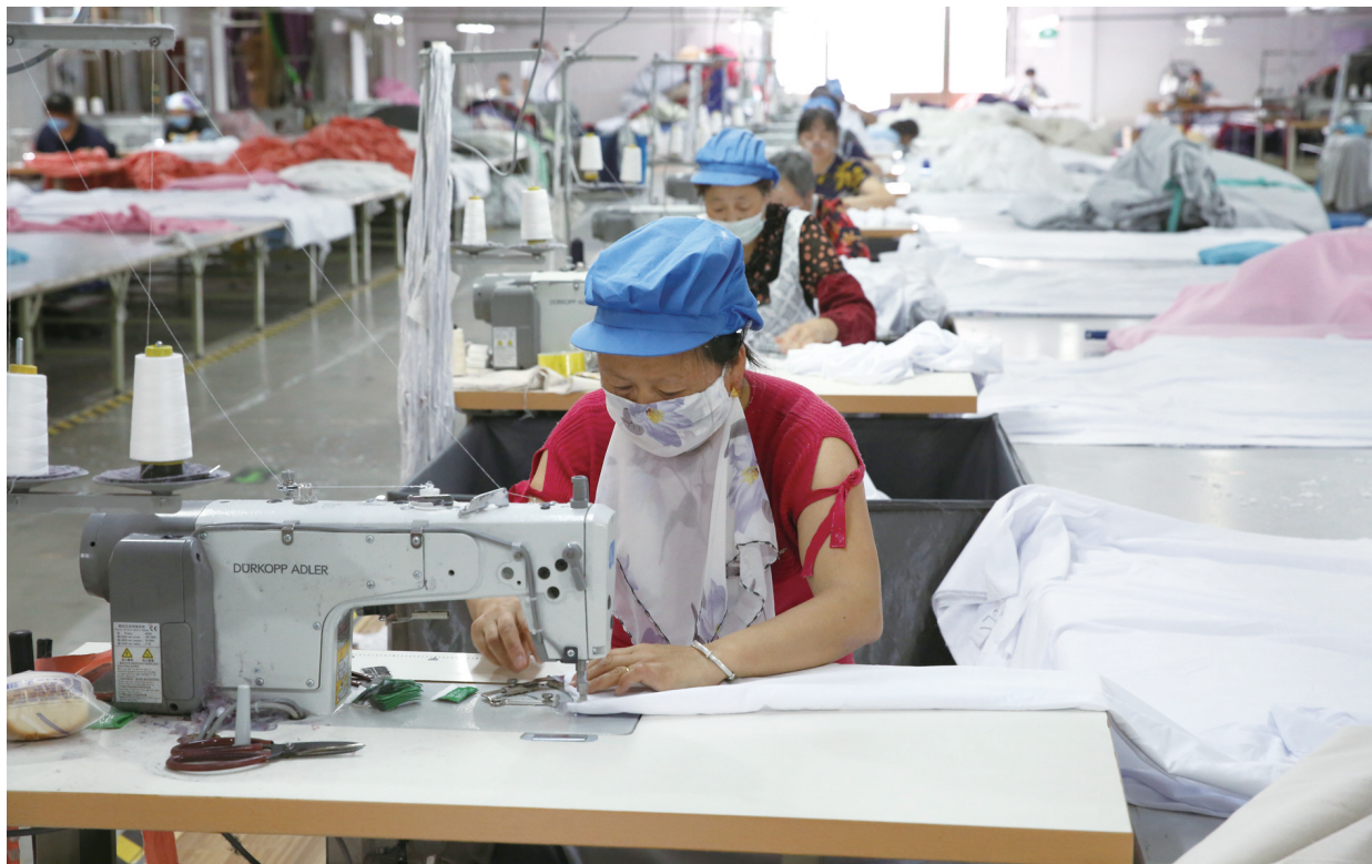
6月24日,三爱家纺有限公司生产车间内,工人们在赶制销往美国的订单产品。今年以来,该公司不断优化产品结构,变过去单一的生产品种为多品种的涤纶床上用品、无胶棉、绗缝被,提高市场竞争力。目前,该公司生产订单不断,1-5月份销售额已达3000多万元,订单陆续排至11月份。