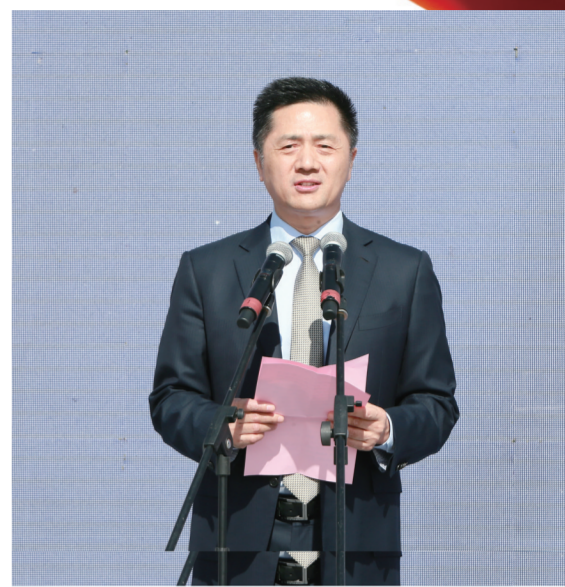
中科院院士、复旦大学附属中山医院院长樊嘉在揭牌仪式上致辞