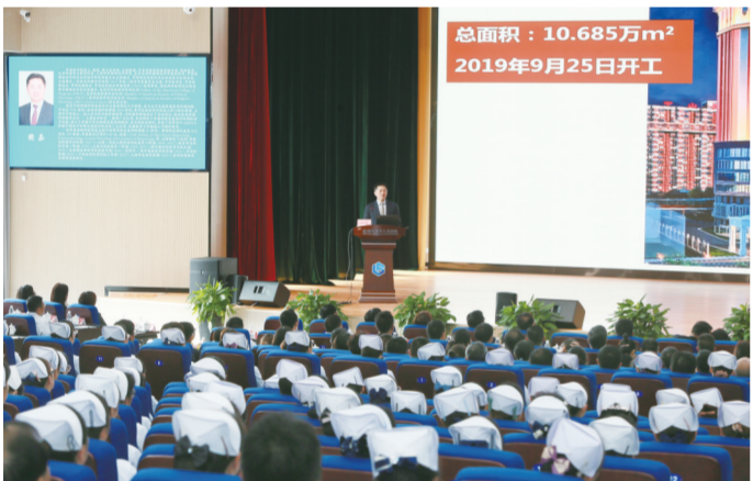
中科院院士、复旦大学附属中山医院院长樊嘉在人民医院会堂作专题讲座