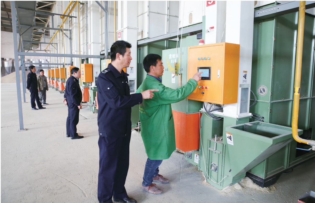
11月15日,大中街道农机站工作人员来到光明村汇坚农业发展有限公司指导粮食烘干工作。去年以来,该街道抢抓政策机遇,优化农机装备水平,着力推进粮食生产全程机械化,粮食生产从零散作业向规模化作业转变,不断提高粮食生产综合经济效益。