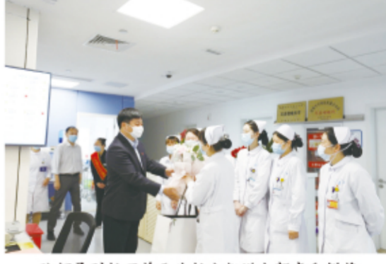
院领导到护理单元为护士们送上贺卡和鲜花