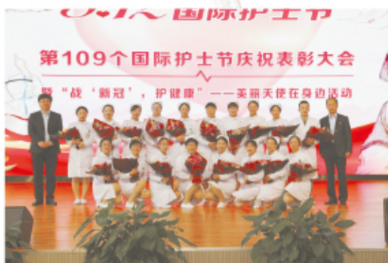
院领导与受表彰的优秀护理工作合影

据了解，5月8日之前，人民医院还组织各个科室的护士举办了户外拓展活动，放松心情，感受美好生活。