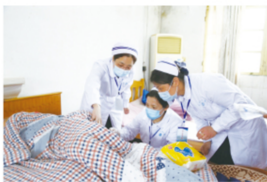
专科护理小组在三龙社区居民家中为压疮患者伤口检查