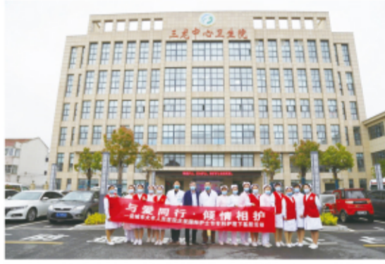
在三龙中心卫生院、方强卫生院开展“与爱同行、倾情相护”专科护理下基层活动