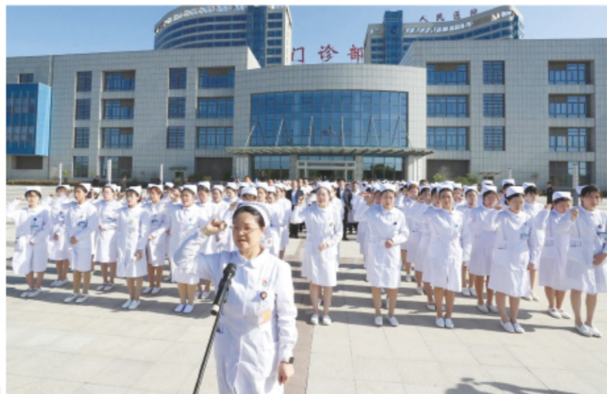
护理人员重温南丁格尔誓言