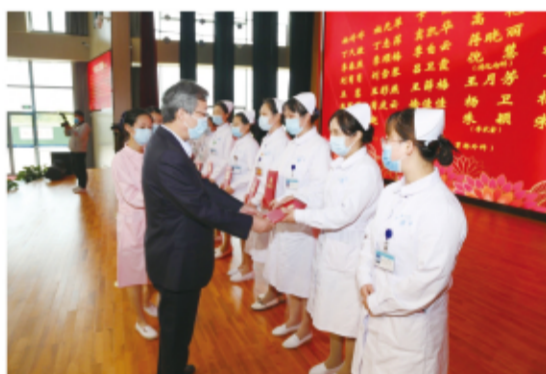
院领导为受表彰的优秀护理工作颁发荣誉证书