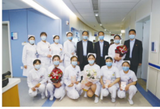
院领导到护理单元为护士们送上贺卡和鲜花