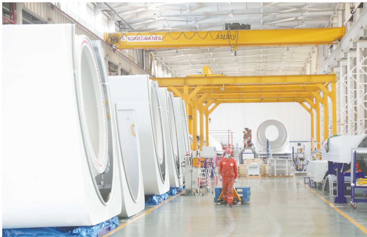
5月21日，江苏金风科技有限公司生产车间内，技术人员忙碌生产。今年，该公司计划在我区构建海上风电整机+部件实验平台，加大出口基地建设，推动中国海上风电装备制造从大丰走向世界。

“走进农村”，以“机关+农村”党组织结对共建为契机，组织机关党员干部走田头、走农户，密切联系群众，帮助群众解决矛盾和问题。发挥区级机关部门优势，提供技术咨询和信息服务，为联建村推进旧村改造、新村建设、路桥修建等民生实事提供一定的资金支持或实物帮助。“走进企业”，以科级干部挂钩服务企业为桥梁，组织机关党员干部到企业走访调研，支持和帮助中小企业应对各种局面。挂钩服务干部每月到企业走访调研一次，了解企业疫情防控落实情况、生产经营情况，对政府服务的需求以及存在的困难等，宣传解读相关帮扶政策，帮助企业协调解决困难。“走进社区”，以决战决胜全国文明城市创建为目标，组织机关党员干部深入包保社区，帮扶困难群众，在重要时间节点开展党员志愿服务，帮助协调解决重点难点问题，推动各项创建工作落到实处。 (杨晨 王淑君)