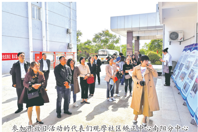
参加开放日活动的代表们观摩社区矫正中心南阳分中心

近日,区司法局积极开展以“依法实施社区矫正,助力和谐社会建设”为主题的“社区矫正开放日”活动。区部分人大代表、政协委员、志愿者、社会公众代表和社区矫正对象家属积极参与,了解社区矫正工作,近距离感受智慧矫正带来的新成果。