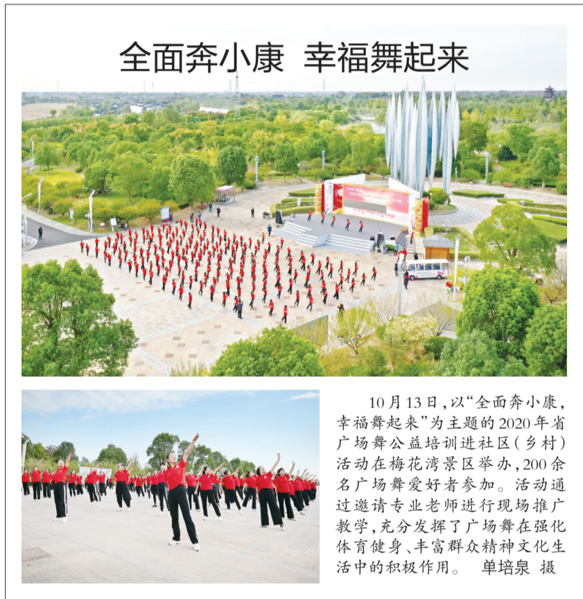
全面奔小康 幸福舞起来

10月13日,以“全面奔小康,幸福舞起来”为主题的2020年省广场舞公益培训进社区(乡村)活动在梅花湾景区举办,200余名广场舞爱好者参加。活动通过邀请专业老师进行现场推广教学,充分发挥了广场舞在强化体育健身、丰富群众精神文化生活中的积极作用。