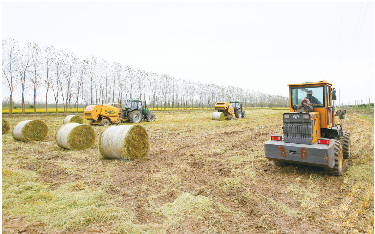
近日,众鑫农业组织多套由自动秸秆捡拾打捆机、田间收集机、夹包装载机组成的“一条龙”式秸秆捡拾收贮机械开进华丰农场,进行现场调试。据悉,对秸秆进行捡拾收贮,加工成饲料或发电燃料,将保证种植企业和农户秸秆安全有效转化,为农林场圃作物秸秆“双禁”提供有力保障。