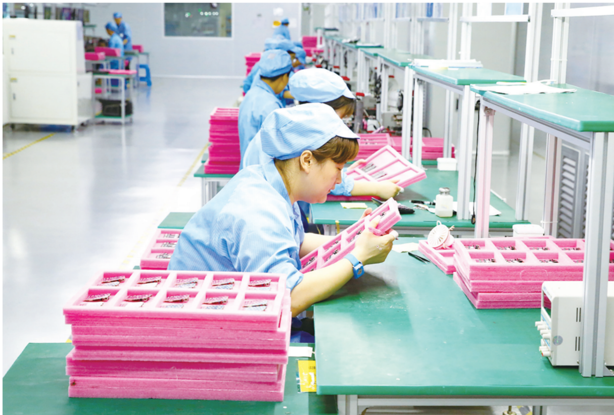
日前,盐城吉凯同科技有限公司无尘车间内,技术人员在生产手机贴片。该公司是一家从事移动智能终端、物联网、智能可穿戴设备、智能机器人等集成研发、设计、生产、销售于一体的多元化企业,产品畅销东南亚、欧洲、澳大利亚等国家和地区。目前,该公司正加大生产力度,力争提前完成各项目标任务。

本报讯 近日,第十届中国粮油榜开榜公布获奖名单。我区江苏佳丰粮油工业有限公司的“恒喜”牌菜籽油荣获“中国十佳粮油优质特色产品”称号。 佳丰粮油自成立以来,坚持以“产业报国,行业领先”为发展目标,以“臻善臻美,普享幸福”为宗旨,先后获得农业产业化国家重点龙头企业、国家高新技术企业、全国放心粮油加工示范企业、中国油菜籽加工10强企业、江苏省农业科技企业等荣誉。“恒喜”商标被国家认定为中国驰名商标,荣获绿色食品博览会金奖。近年来,该公司不断加大转型升级、科技创新步伐,以创新发展理念为动力,先后与江南大学、江苏大学等10多家科研院所合作,拥有发明专利12项、实用新型专利6项,承担国家科技星火计划研发项目3项。该公司在严格做好绿色、优质、安全农产品产销经营的基础上,积极创立产品品牌,以诚信度高、产品质量好的企业形象发挥示范带动作用,取得了良好的经济效益和社会效益。 (沈春涛 陈晓虎)