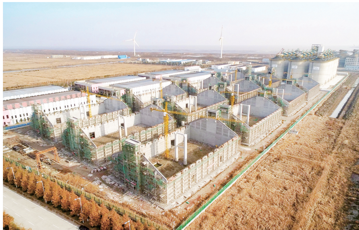
1月12日,俯瞰大宗农产品仓储二期项目建设现场,平房仓地基建设已基本完成,即将进行封顶作业。该项目将建设12栋平房仓,总仓容25.78万吨。全部建成后,将集粮食仓储、物流、保税、期货交割、油脂加工等功能于一体,围绕粮食码头+大宗农产品仓储,整合大丰港粮食产业链,促进港区经济发展。

该镇着力打造钱氏卷瓦楼、盐课司署、茶食铺子、碑志拓片展示馆等一批特色景点,精心布置张士诚传说等非遗展示馆,打造“串场河风光带”上重要节点。坚持以旅游发展提升集镇形象,投入500万元实施竹溪古街提升工程,对仿古建街进行全面修建提升,达到“仿古像古、修旧如旧”的效果,凸显传统建筑特色。该镇将继续深挖厚植草堰古盐文化、吴王文化元素,加快形象提升、配套完善,不断提升古盐运文化吸引力。做深文旅融合文章,建设文化水街、串场河人文景观廊道,规划建设生态停车场、餐饮住宿、汽修保养等功能于一体综合服务区。丰富旅游产品供给,积极包装打造麻花等草堰茶食特色旅游商品,结合非遗、盐运文化合理设计旅游产品,让游客“有得吃、有得玩、有得带”,推动旅游要素“链式”发展。(李理)