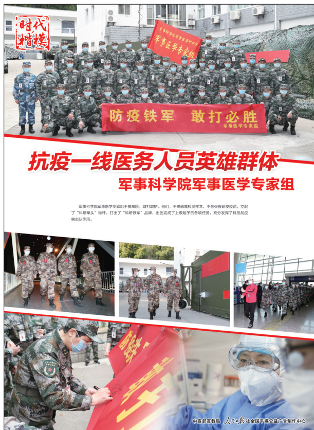
抗疫一线医务人员英雄群体 军事科学院军事医学专家组