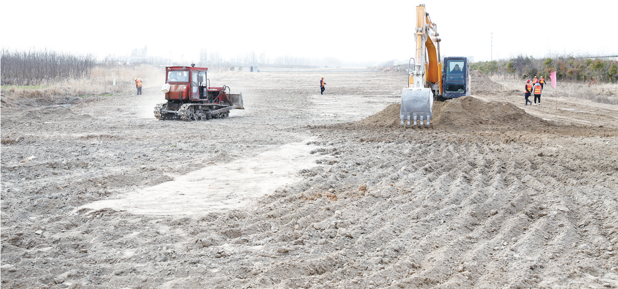
近日,新时代大道延长线项目正如火如荼建设中。据悉,该项目东起新时代大道现状终点处,西至226省道,长2116米,宽30米,还将建设一座跨老斗龙港的桥梁,项目计划12月竣工通车。