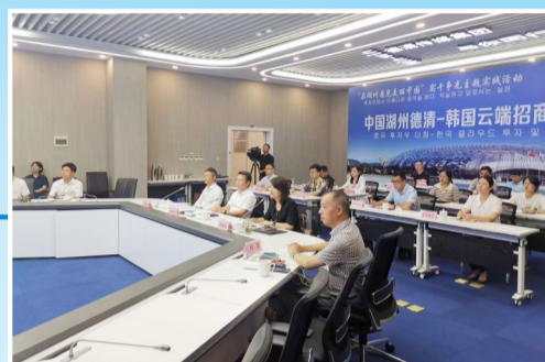
中国湖州德清-韩国云端招商引才推介会