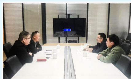
长三角招商引才二分局拜访客商