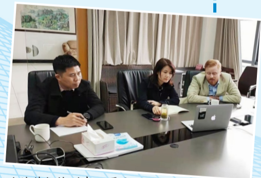
洽谈德凯检测中心项目