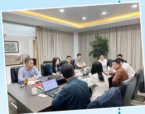
市商务局一起洽谈QFLP试点项目

整合协会资源。整合已签约的中介招商机构和现有企业、社会团体、乡贤、机关干部等资源,形成整体联动、分工合作、精准对接、高效服务的招商新体系。今年以来,全县已累计引进签约亿元以上产业项目98个,完成全年任务的75.4%;其中3亿元以上项目43个,完成全年任务的67.2%;10亿元以上项目10个,完成全年目标任务50%。