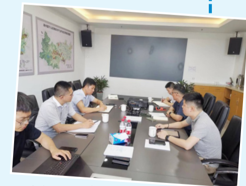
接待中欧创新中心项目