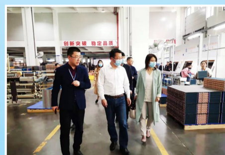
长三角招商引才四分局拜访客商