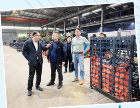
长三角招商引才一分局考察项目

依托三大平台,今年县商务局联合其他部门精心策划举办了各类招商引才推介活动,分别于1月14日、7月6日、7月12日举办了各类招商引才推介会及半年度集中签约等重大活动,同时积极谋划在上海、深圳的专场推介会,进一步为县高质量发展积累人脉、积蓄能量。