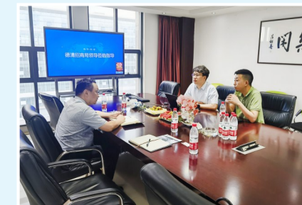
长三角招商引才四分局拜访客商