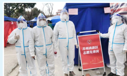
长三角招商引才二分局在苏州参加社区志愿队伍维护现场秩序