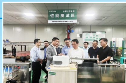
长三角招商引才一分局考察高新技术企业