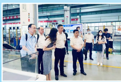
粤港澳招商引才中心洽谈项目

高数据、高成色、高趋势,全县招商引资局面火力全开,这得益于全县上下配足配强招商团队力量,不断完善招商引资政策,健全政务服务体系。“招商引资是产业发展最前沿的工作,因此想要做好招商工作,就必须要把招商工作放在心里,把项目推进作为首要任务。”县商务局相关负责人表示。