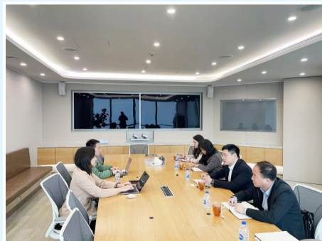
京津冀招商引才中心拜访企业