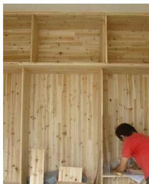
木工打造柜子价格=柜门+抽屉+配件+五金+柜体投影价格(主材+辅材+人工)+油漆+利润

木工现场打造衣柜,就是直接找信得过的木工根据个人的衣柜设计需求和位置大小进行一个现场制作。