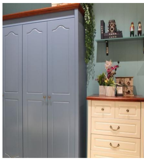
成品衣柜价格=商场现价

成品衣柜就是直接到家具商购买现成的衣柜。成品衣柜选择比较多,不过没办法完全跟家里的空间匹配,毕竟是直接购买的成品。