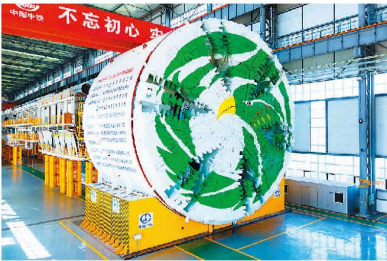
2018年，直径15.8米的中国中铁588号“春风号”盾构机下线。