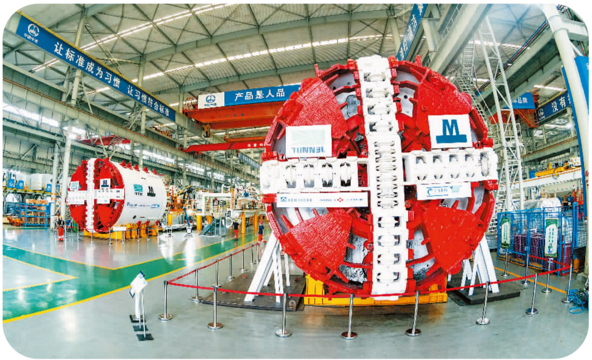
用于丹麦轨道交通建设的中国盾构机。

首台联络通道专用盾构、世界最大直径硬岩掘进机等新产品不断涌现。在与国外盾构竞争中，国产盾构在国内市场的占有率达90%以上，占全球市场份额2/3，并将同类产品价格拉低40%。