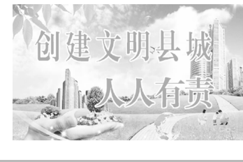
创建文明城市 人人有责