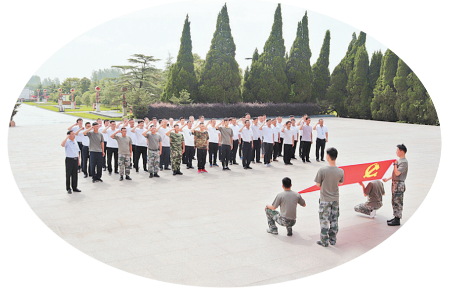
淮北退役军人事务部门组织待安置临时党支部党员参观烈士陵园

安徽省退役军人事务厅相关负责人介绍，这些形式多样的主题党日活动，进一步增强了退役军人党员坚定跟党走信心，激发他们在各自岗位再立新功。