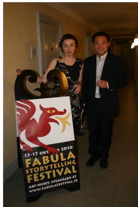
与爱尔兰讲故事人在瑞典福布拉故事节