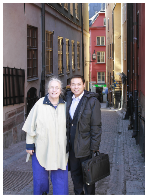
与汉学家易德波在斯德哥尔摩