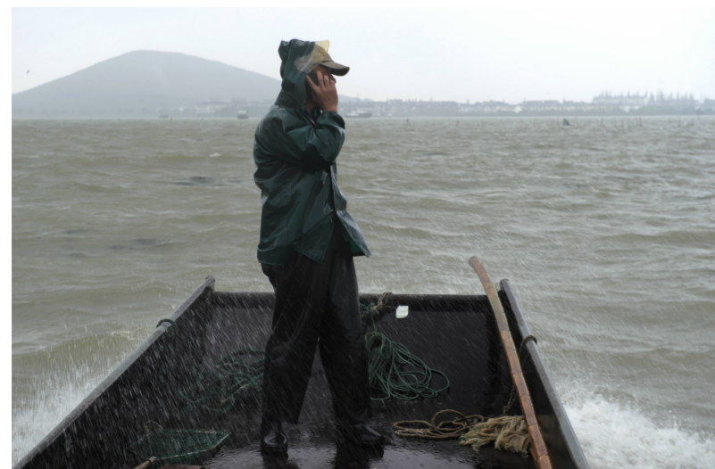
归航的路上,老张在联系买家。