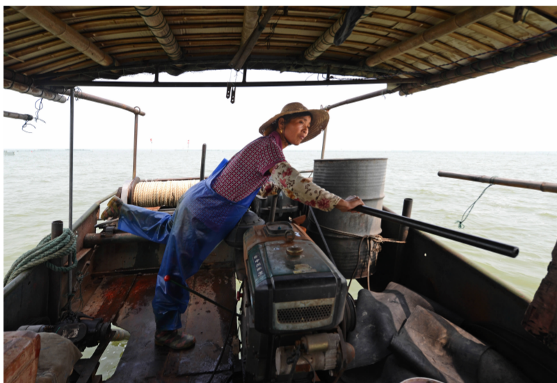
太湖人不重男轻女,妇女也照样掌舵,手上掌着舵,脚还控制着起网机的开关。