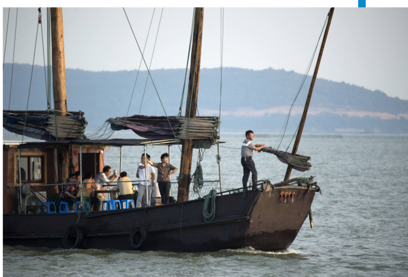
渔闲季节渔民做起了旅游生意,他们带着苏州、上海、无锡等地的城里人乘着帆船到太湖中尝尝湖鲜,看看湖景。