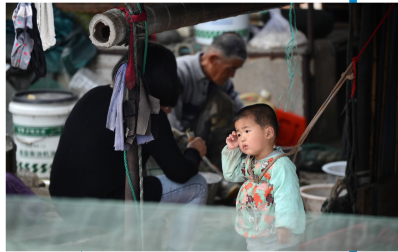
为防止小孩掉落水中,船上的小孩都要用带子拉住。