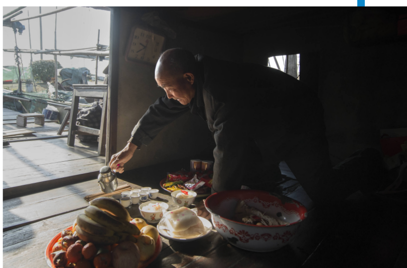
腊月二十五到二十九这几天,船上人家要在船上拜祭湖神和土地神,祭品有酒、肉、水果和糕点等,祈祷来年全家平安健康、捕捞丰收。