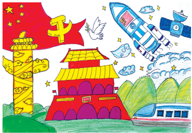
丰县寨镇东渡希望初级中学八(2)班 李欣怡 指导老师:韩伟