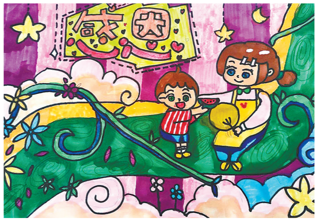
丰县大沙河镇中心小学李寨校区六(2)班 唐明 指导老师:孙爱侠