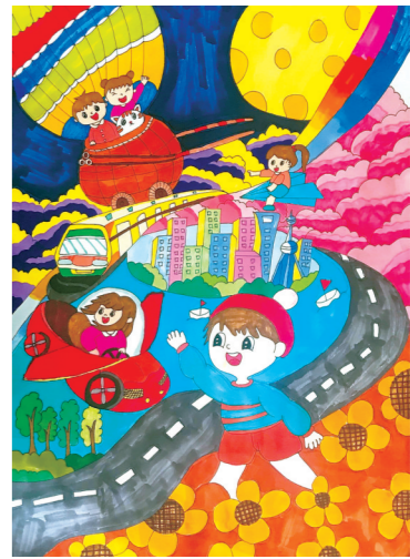
丰县范楼镇京庄小学 陈可馨 指导老师:丁淑娟