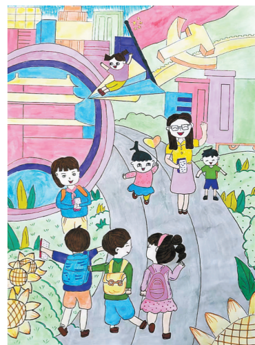
丰县孙楼街道办事处中心小学 四(2)班 屈可欣 指导老师:李文文