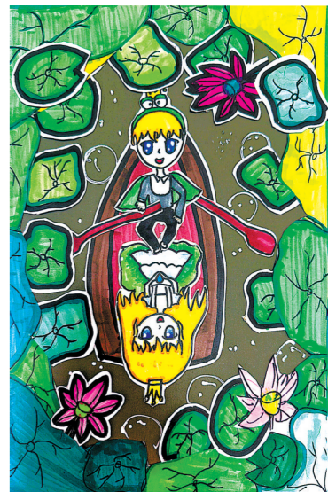
丰县人民路小学凤凰校区 三(1)班 王可辰 指导老师:刘永爱