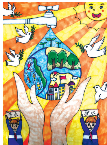
丰县梁寨镇中心小学 四(6)班 任书瑶 指导老师:李秀秀