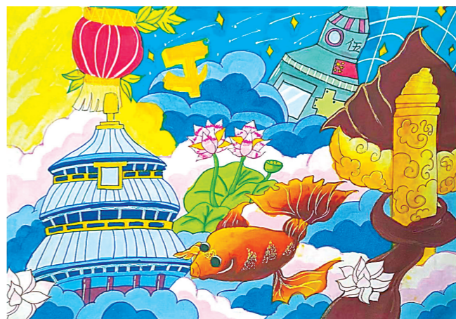
丰县实验初级中学小学部六(5)班 祝靖琪 指导老师:马丽