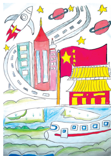
丰县欢口镇中心小学 五(4)班 董书豪 指导老师:王可