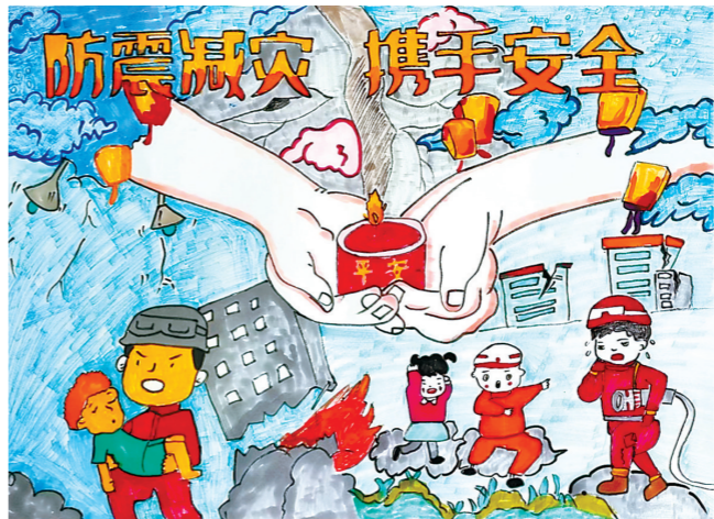
丰县王沟镇中心小学三(4)班 孙雯雯 指导老师:黄翠梅