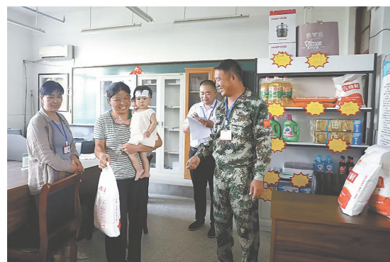
本报讯(融媒体记者 路硕 赵雯慧)美丽乡村要美得长久,当务之急

是要考虑“如何管”。为建立村庄垃圾清理整治长效机制,促进人居环境改善,把“门前三包”责任制落到实处,提高群众参与的积极性和主动性,凤城街道每月开展“门前三包”落实程度评比活动,并折算成相应分值计入积分卡。 近日,丁兰集社区村干部热闹非凡,多位村民用自己参与环境卫生整治、美化自家院落等活动时获得的“积分”“模范户称