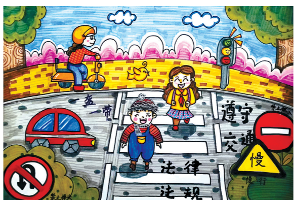
丰县新城实验小学二(4)班 董又溪 指导教师:鹿莎莉