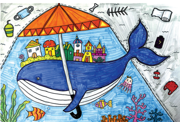
丰县梁寨镇中心小学六(1)班 黄梦宣 指导教师:李秀秀