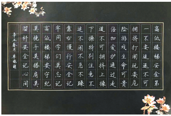
丰县王沟镇中心小学六(4)班 单晓萌 指导教师:李世秋