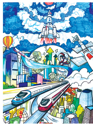
丰县实验小学丰邑校区 六(1)班 史雨鑫 指导教师:王文凤