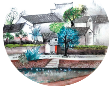
丰县师寨镇希望小学五(4)班 黄玉 指导教师:张志刚