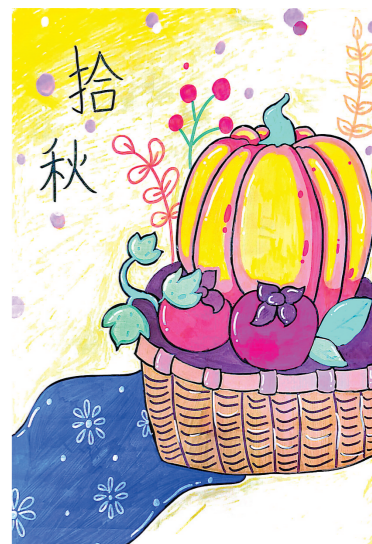
丰县范楼镇京庄小学 四(1)班 宗紫涵 指导教师:赵艳红