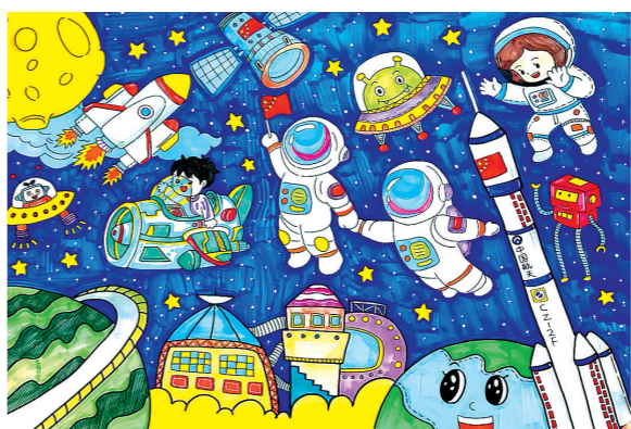
丰县人民路小学文博校区六(5)班 薛怡然 指导教师:黄红梅