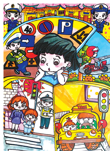
丰县首羡镇和集中心幼儿园 大(1)班 于可欣 指导教师:朱林