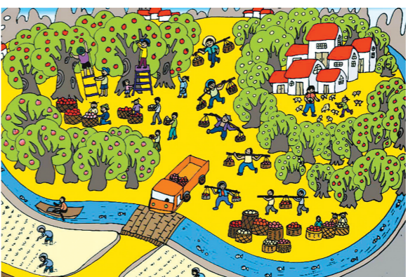
丰县大沙河镇沙河校区五(2)班 李欣怡 指导教师:李春雨