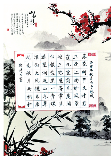
丰县欢口镇常庄小学 三(3)班 张梓钰 指导教师:梁丽