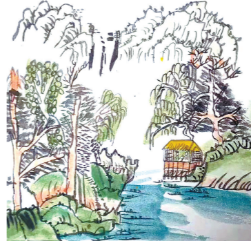
丰县东关小学四(1)班 张婷娜 指导教师:王莹珠