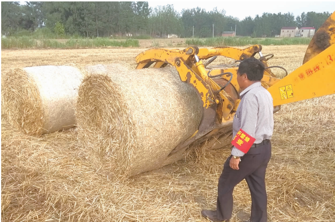
连日来，新集镇在夏季秸秆综禁工作中，积极引导农户合理利用麦秸，将麦秸打捆出售，变废为宝，在保护环境的同时，带动农民增收。图为农机手正在进行秸秆打捆回收。

本报讯 连日来，夏收大忙正如火如荼地进行，北陈集镇夏季秸秆禁烧工作全面铺开。 该镇专门制定秸秆禁烧具体实施方案，通过召开会议详细安排部署、动员广大干部积极参与、多部门联合发力，确保禁烧工作无死角。通过到村宣传秸秆禁烧，悬挂条幅100余条麦田防火标语，户外宣传版面30块，值守点30个，大力宣传秸秆禁烧重要意义，宣传农作物秸秆焚烧造成的危害性，宣传秸秆禁烧工作的相关法规，不断提高群众禁烧秸秆和秸秆还田的自觉性，在全镇营造了“禁烧秸秆，美化环境”的浓厚氛围。 该镇通过建立麦收防火责任制网络体系，镇政府与各村（社区）签订责任书，缴纳履职保证金，明确镇分工干部包村、村干部包组、组长包户，形成一级抓一级，层层压实责任。北陈集镇派专人督导巡查禁烧工作情况，对到岗到位及秸秆禁烧工作情况进行通报，确保秸秆禁烧工作落到实处。北陈集镇紧抓麦收有利时机，全力打好夏季秸秆禁烧攻坚战，做到“不着一把火”，实现“零火点”，确保麦收防火安全，全面吹响镇秸秆禁烧与综合利用工作的“冲锋号”。 (刘青 王浩宇)