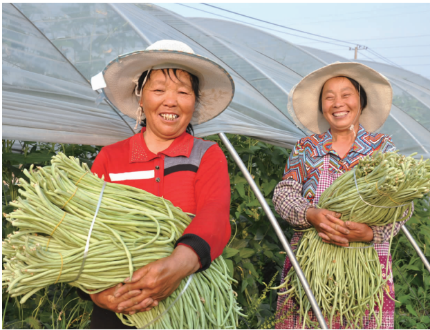
6月13日，田楼镇菜农正在喜收豆角准备上市。据介绍，进入夏季以来，我县豆角、辣椒、西红柿等蔬菜价格一直走高，目前市场价格每公斤在6.6元左右。

传，尤其做好对外来收割机手的政策讲解和服务工作。收割机切碎抛撒装置要安装到位，秸秆切碎长度要控制在7厘米以下、留茬高度要控制在10厘米以下，对不符合要求的坚决做到不允许收割；坚持做到“收一块还一块”、“即收即耙”，确保还田及时，消除可能存在的隐患。 据悉，该镇还将继续高强度落实“综禁模式”，利用近来一段时间的晴好天气，积极动员群众收割夏粮，做好辖区内收割机械调配，加快收割进度，保证用3~5天的时间全面完成夏粮收割，为水稻种植打水工作如期进行奠定基础，圆满完成综禁任务。 (杨敬玉 张金龙)