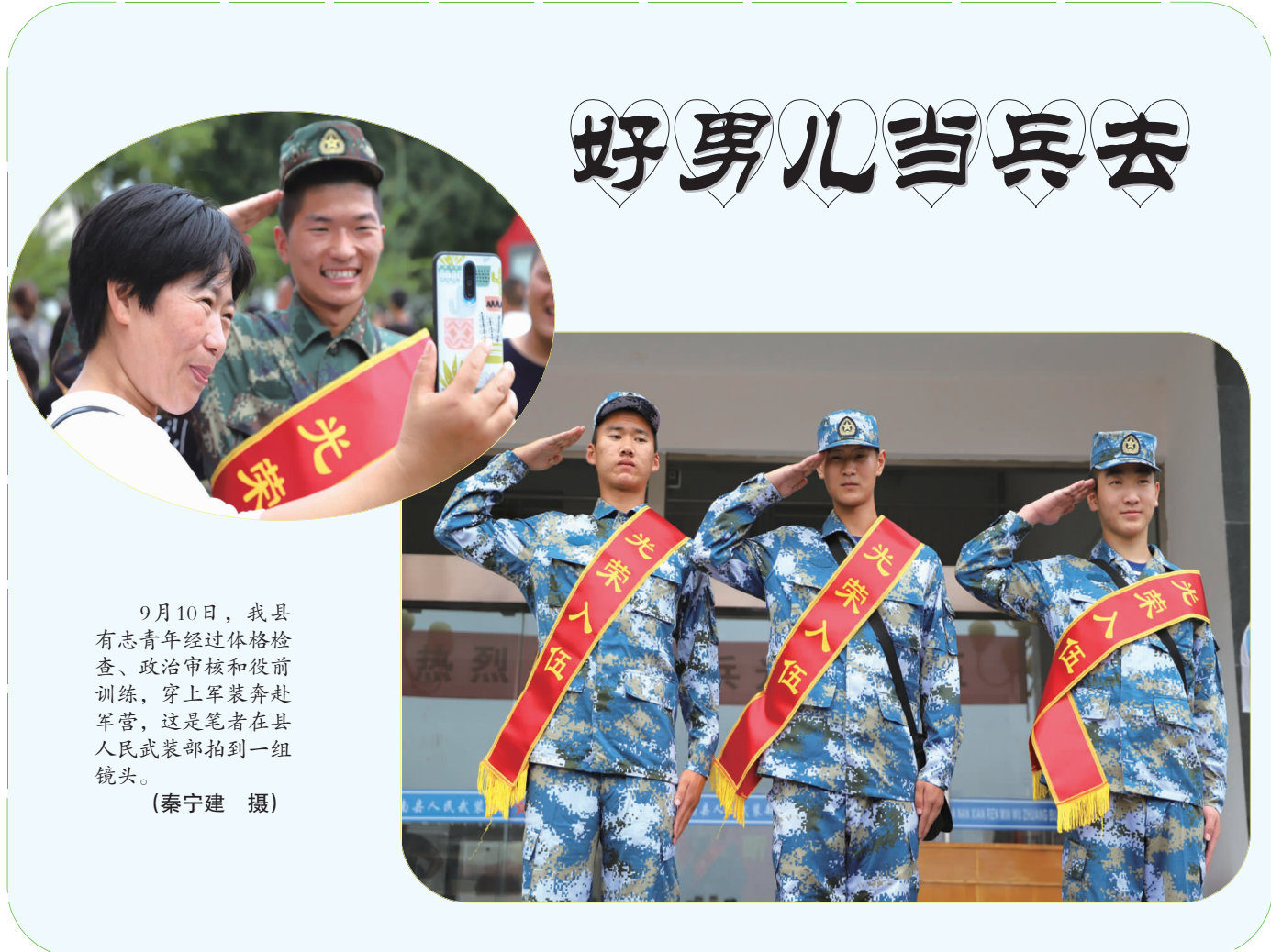
9月10日,我县有志青年经过体格检查、政治审核和役前训练,穿上军装奔赴军营,这是笔者在县人民武装部拍到的一组镜头。

截至9月份,县卫生监督所共出动监督员248人次,检查单位75家,受理非法行医投诉举报31起,查实13起。上半年,非法行医案件共29起,罚款18万元,没收药品器械20余箱,没收违法所得3600元,移交公安机关3起。