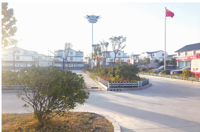
□ 融媒体记者 夏丹华

一进硕项村，映入眼帘的是一栋栋红瓦白墙的楼房，整齐美观，宽阔的道路两旁行道树满树金黄，疏通后的河塘碧波荡漾。一位中年妇女，站在河塘边垂钓，走近一看，收获颇丰。“我钓鱼这地方原来就是一条臭水沟，经过疏浚后河水清