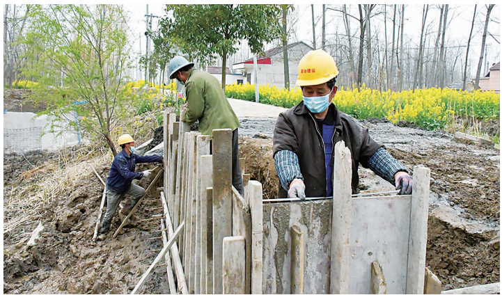
新集镇孙湾村农开项目共投入749万元，内容包括新建电灌站水泥渠、水泥路、桥、涵洞，记者在现场看到，涵洞项目正在加紧施工，该整体项目预计在5月30日前完工。

具体流程中扣准“四严格”。县人社局工资科严格界定范围，规定纳入绩效工资总量核定的，必须是事业单位在编在岗人员；严格绩效考核。要求各用人单位须在奖励性绩效工资发放前，严格制定切实可行的绩效考核实施方案，并报工资部门备案；严格质量把关。依托综合管理系统采取软件与人工双审核的办法，确保准确性与时效性。加大政策宣传，要求各单位对所报送人员要有情况说明，排查各种不应纳入总量核定的人员类型，即对长期病假等不在岗、退休时间认定为2019年度以前的、年度考核未达合格及以上人员等不予核定，以防违规申报造成财政资金流失，保证总量核定的严肃准确性；严格监督检查。要求各单位既要准确把握工资政策，又要灵活运用绩效考核手段，且相关部门要加大监督检查和协调配合力度，着重监督检查人员核定、考核办法和发放依据，确保2019年度奖励性绩效工资核定顺利完成。