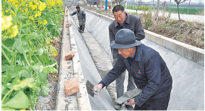
近日，在田楼镇浦东村，施工人员正在修建灌淤渠。连日来，该镇抓住春暖有利时机，把兴修农田水利建设作为当前农业工作重点，高标准改善农业基础水利设施，筑牢粮食丰产丰收的根基。

下一步，县医保局将与县一院密切配合，科学安排，规范操作，并通过采取严格的绩效考核方式，全力推进我县机关事业单位工作人员体检工作有序开展。