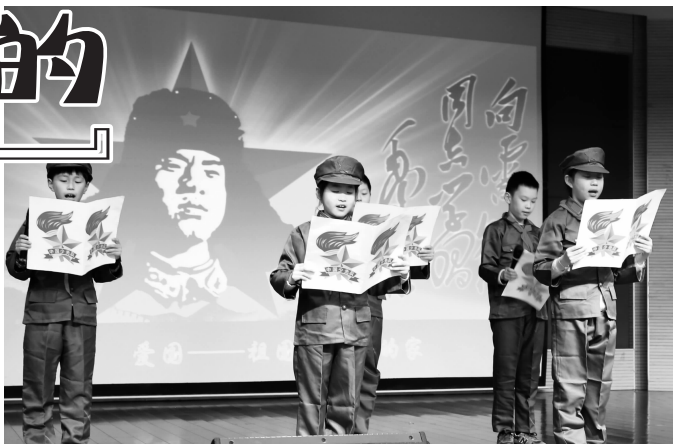
常熟国际学校同学用诗朗诵倡议“学雷锋 传正能”。胡玉霞 彭蕊 摄

开学了，回到校园的靖江市中小学生在认真学习雷锋精神、续写雷锋日记。走进三月的中小学校，“学雷锋”一样成为了其它学校校园文化的主旋律。“雷锋叔叔”做主角，各所学校那各具特色的校园文化活动，叫人目不暇接。学生们唱雷锋、读雷锋、讲雷锋、写雷锋，在亲近“雷锋叔叔”的同时，也在争做“小雷锋”。