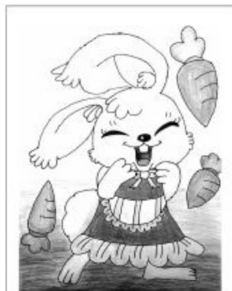
快乐的小兔 句容市天王中心小学 五(2)班 蒋雨莹

选自滨海县界牌第一中心小学《清水湾》 滨海县界牌第一中心小学四(3)班 豆豆 指导老师 陈树楼