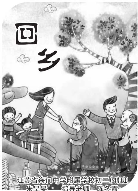
江苏省海门中学附属学校初三(4)班 朱昊昊 指导老师 陈冬霞

回乡的我们。 院子里堆了一簇烧得黑一片白一片的纸钱余烬，被风吹得飞起来。菜肴没动一箸，都另用一只碟子扣着。灶上温着一些有点凉了的菜，这会儿拿出来，覆着的水汽越凝越大，沿着碗边骨碌碌地接连着滚落，像泪珠儿似的，难道在责怪我们怎么回来晚了？