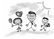
我家的故事·咱家40年