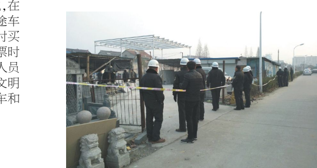
2 月 5 日上午,区城管局组织 40 余名执法人员,开展专业施工队伍,动用四辆机动车及电焊、气割等工具,成功拆除丁西大街沿街出北侧“大地石村”院内约 78 平方米的违法建设。此前,该局组织 30 名执法人员,对市内副食大楼五楼楼顶 38 平方米的违法建设进行了拆除。