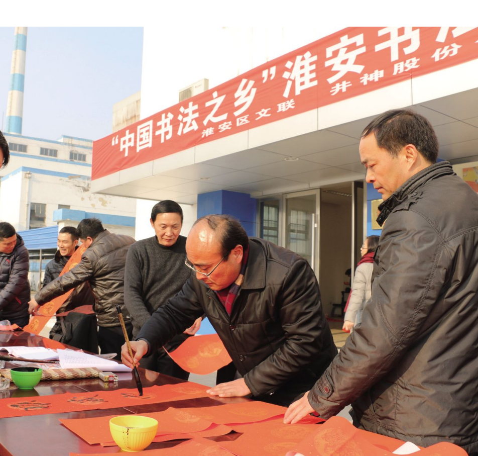
春节前,区文联和区书法家协会组织我区书法家走进并神盐股份有限公司,为企业职工书写饱含新春祝福的春联,将中国传统文化“年货”送到他们的家门口。此次活动既让职工体验了书法艺术的魅力,又增添了企业的春节氛围,受到职工的热烈欢迎。

港口建设投入资金 23.29 亿元,重点建设多功能、综合性港口,满足不断增长的港口货物运输需求。一是建设年吞吐量 644 万吨的京杭运河上河作业区一期工程,二是规划建设头溪河港区,形成集仓储、转运为一体的综合枢纽码头。三是规划建设年吞吐量 480 万吨的国信燃煤电厂专用码头,四是规划建设年吞吐量 550 万吨的新材料产业园码头,五是规划建设年吞吐量 1200 万吨的淮河入海航道季桥作业区。 航道建设投资 10 亿元,进一步提升水运保障能力。整治淮河航线(规划二级)航道,建设 1.5 公里船舶停泊区,实施头溪河航道上游 5 公里七改二级改造,重点移址的二堡船舶和二堡大桥扩建,对苏北灌溉总渠航道上游 10 公里浅段进行疏浚,建设淮河