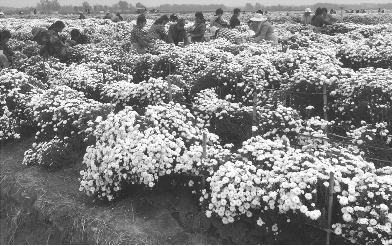
南闸镇中草药产业园茶饮菊花采摘忙。中草药产业园于 2016 年年底开始建设,2017 年共种植七月菊、金丝皇菊、徽州皇菊、徽州小黄菊、贡菊等品种共 1000 余亩的茶饮菊花。

日前,河下街道螺蛳街村喜洋洋广场舞队代表我区参加“淮安市第二届福彩杯最美夕阳红”老年人广场舞比赛。通过激烈的竞争,该队表演的《幸福万年长》从 22 支具有实力的队伍中脱颖而出, 夺取全场比赛的一等奖。