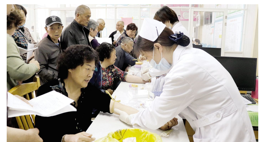
5月13日上午,淮城街道城西社区服务中心医护人员,在区皮防院免费给社区65岁及以上老年人体检。图为医务人员给老人抽血化验。

萧湖泵站新建工程是集城区水环境治理、水景观提升,解决城区防洪、排涝问题于一体的重要工程,目前已全部建成并通过试运行。施恩佩要求,区水利部门要进一步健全安全生产保障措施,落实好水利设施管护保养责任,同时完善好与城区管道之间的对接,确保汛期真正能够打得响、排得畅。泾口中学校排涝泵站因年久失修,已无法发挥效益,新建工程于今年3月开工建设,计划5月底完成主体工程并投入使用。施恩佩要求,区相关部门、镇(街道)要针对全区防汛的各个重点部位、重点时段、重点区域、重点工程的设施设备进行一次全面排查,坚决做到发现问题一个、限期整改一个,真正实现排查全覆盖、整改全落实、监管全过程。对在建的工程项目要加快建设进度,在保证质量的同时,确保在汛期前投入使用。(下转第四版)