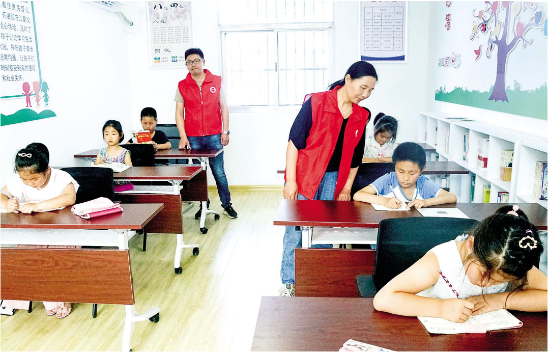
石塘镇新时代文明实践所作为全区新时代文明实践所、站示范点,1000平方米的服务区域内,志愿服务站、百姓理论创排室、书画培训室、健康服务室、四点半课堂等10个功能室配备齐全。图为留守学生在四点半课堂认真学习。

从8月份开始,我区全面启动社保补贴的申报、审核工作。为促进就业困难人员再就业,区人社部门通过内部梳理、外部“取经”,制定切实可行措施,开展社会保险补贴工作,将该项惠民政策落到实处。 着力提高业务技能。该部门召开全区基层人社工作人员社保补贴专题会议,对业务经办人员进行专项培训,详细讲解社保补贴的申报条件、补贴标准、所需材料、办理流程、注意事项等业务内容,进一步规范经办流程。 着力加强政策宣传。该部门以基层人社平台为抓手,通过电话、人力资源市场微信、张贴公告、印发宣传单等不同形式对社保补贴政策进行广泛宣传,不断提高政策知晓度,做到应知尽知。 着力优化申报流程。该部门严把材料审批关的同时,精简办理流程,提高工作效率,让群众少跑腿。