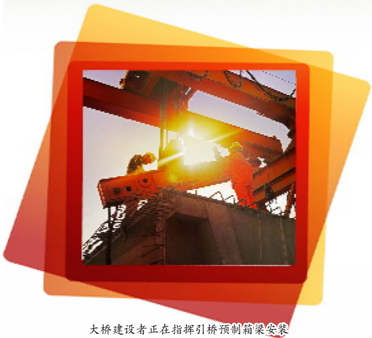
大桥建设者正在指挥引桥预制箱梁安装

运镇等5个镇,连接盐城阜宁县与我区、洪泽区,建成后将成为沟通盐徐高速公路、京沪高速、宁淮高速的重要通道,具有淮安南绕城公路的功能,也是淮安市通海的重要通道。公路计划于2020年10月建成通车。