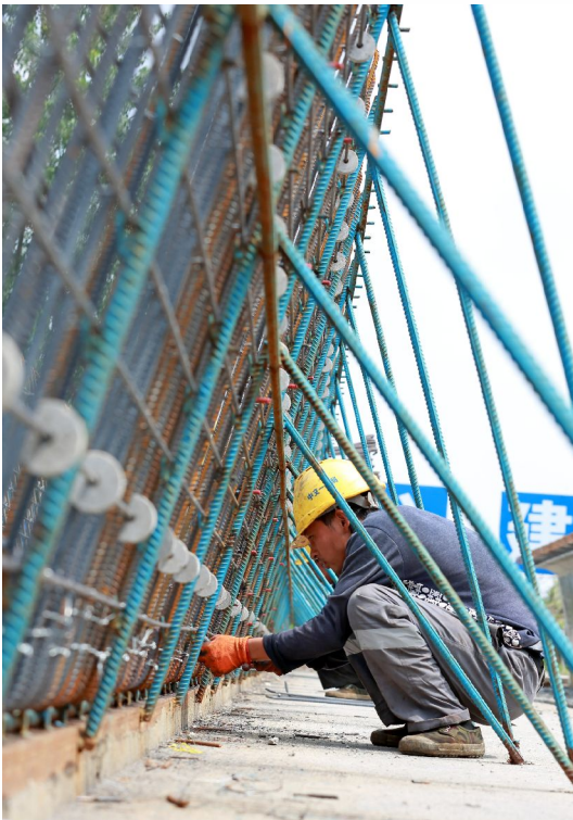
施工人员进行预制箱梁钢筋绑扎作业