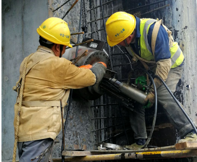
施工人员进行主桥箱梁预应力张拉作业