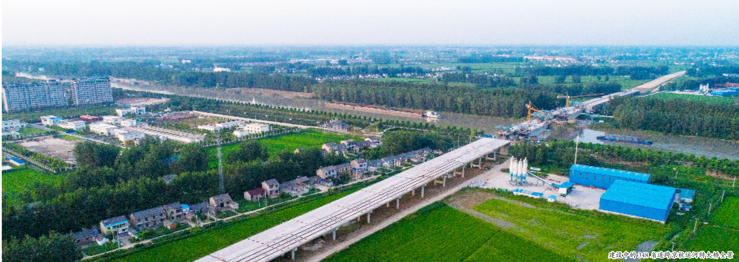
建设中的348省道跨京杭运河特大桥全景