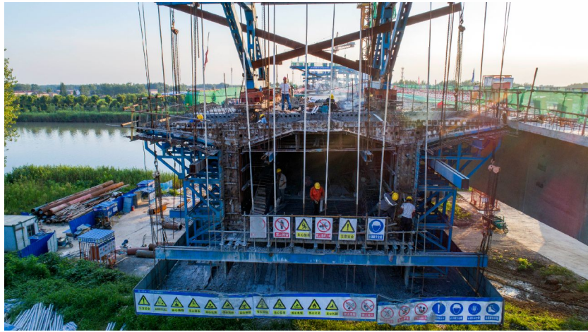
施工人员进行下一段挂篮施工现浇的各项前期准备工作