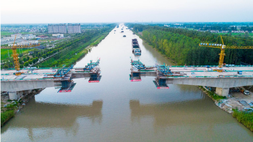
大桥主桥合龙进入冲刺阶段