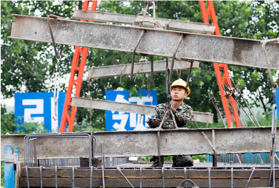
施工人员进行限位模板吊装作业