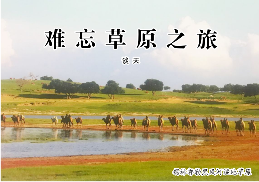
锡林郭勒黑风河湿地草原

“敕勒川,阴山下,天似穹庐,笼盖四野。天苍苍,野茫茫,风吹草低见牛羊。”30 多年前读到的这首北朝民歌,给了我到草原的第一印象,每次从电影、电视上看见壮美辽阔的草原,都让我沉醉于一望无际的绿色和策马奔驰的美景,也憧憬着有一天能够亲身领略一番想象中的大草原。伴随着多年的梦与期望,怀着仍然年轻冲动的心情,8 月份我们终于成行,踏上了通往内蒙古锡林郭勒大草原的旅程。