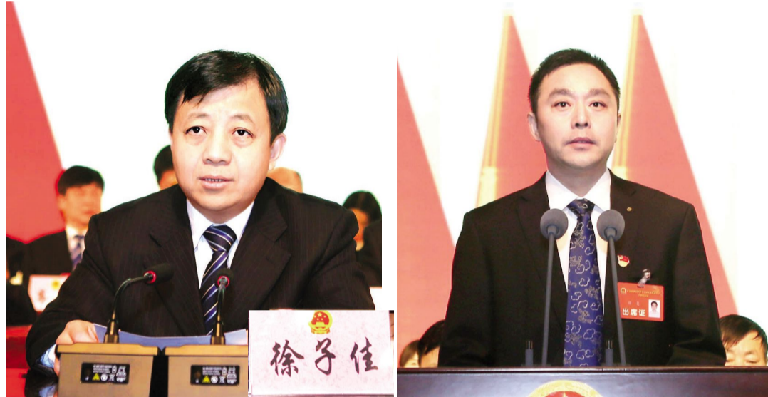
区委书记徐子佳主持大会