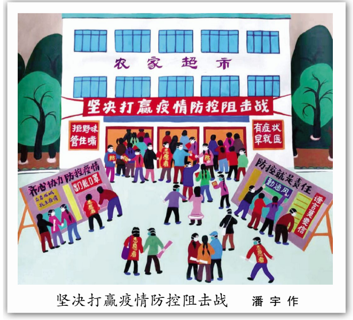
坚决打赢疫情防控阻击战 潘宇作

春风啊,带去我的问候吧——那里有我的素未谋面的朋友!此时不知道她在闭目想什么?还是在医院里战斗?