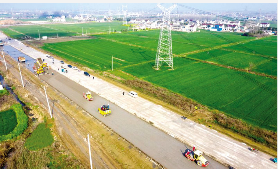
省重点交通工程348省道淮安段项目建设现场机器轰鸣，热火朝天。在精准落实各项疫情防控措施的前提下，区交通部门会同施工单位以“与时间赛跑”的紧迫感按下交通工程建设的“快进键”，努力把疫情耽误的时间抢回来。

肖进方希望我区认真落实我市出台的扶持生猪生产政策措施，争取项目早建成、早投产、早见效，全力做好生猪稳产保供“菜篮子”工程。