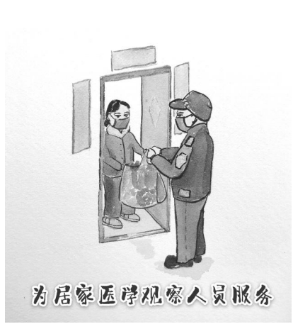
为居家医学观察人员服务

近日,国家医保局医药服务管理司负责同志接受中央纪委国家监委网站专访,介绍了新冠肺炎患者治疗费用保障工作,受到广泛关注。国家医保局会同财政部明确提出“确保患者不因费用问题影响就医、确保收治医疗机构不因支付政策影响救治”的“两个确保”要求。医保部门对确诊和疑似患者全部实行先救治、后结算,在基本医保、大病保险、医疗救助等按