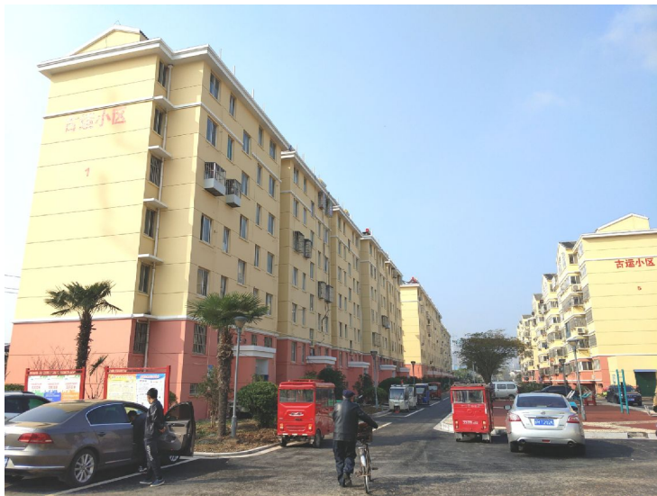
改造后的古运小区节能环保型外墙