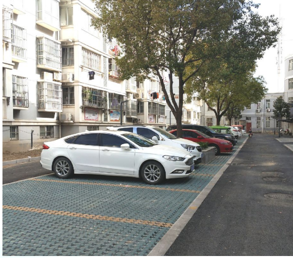
改造后的富士花苑停车位