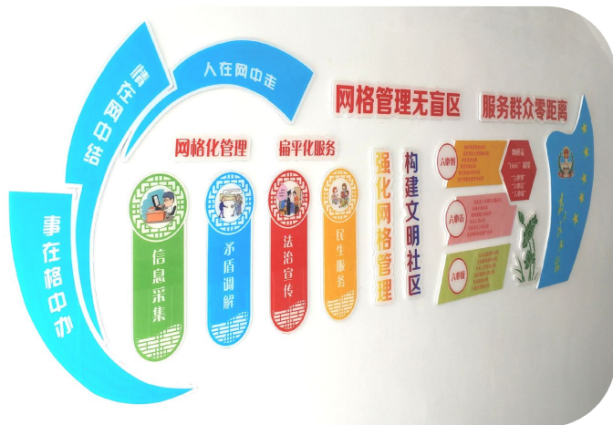
河下小区新增楼道文化