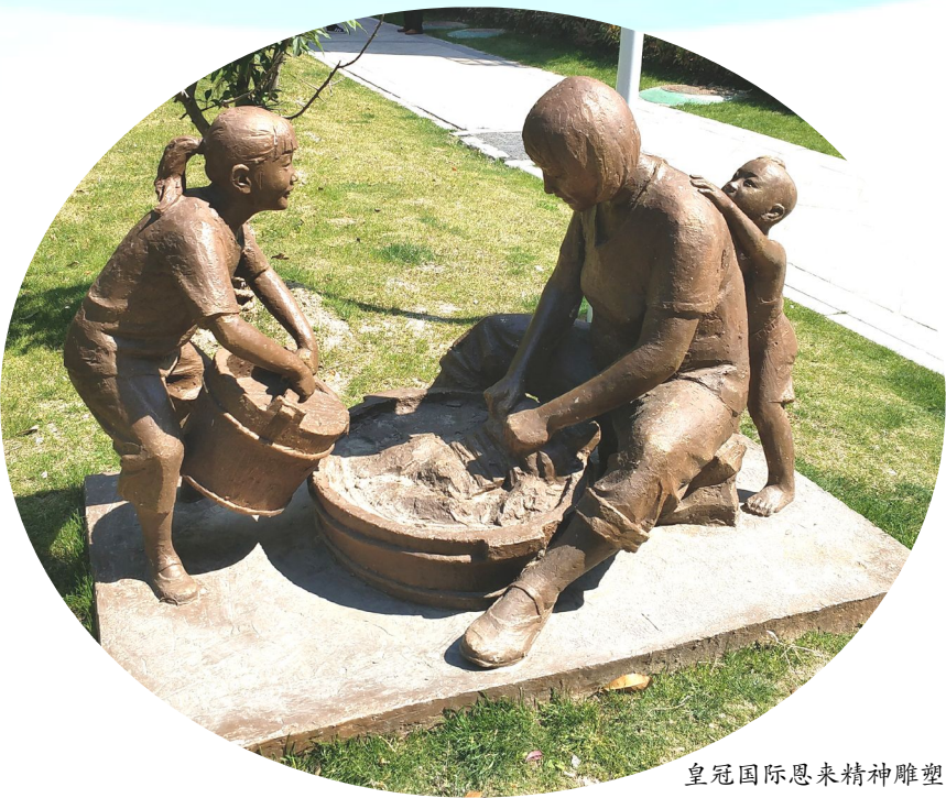
皇冠国际思来精神雕塑

面对疫情防控造成的影响,为确保赶在国测前完成今年老旧小区改造提升任务,区各相关部门正抢抓时间节点,提升工作站位,提高工作要求,提档工作标准,提速工作进程,以更多的成果巩固老旧小区改造,争取为淮安创建全国文明城市作出更多更大的努力。