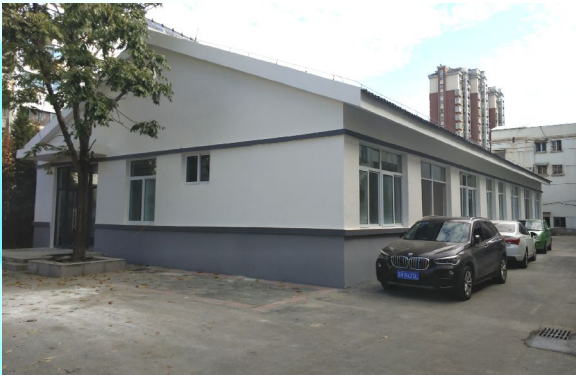
改造后的新城小区养老中心