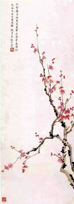
谈月色（1891—1976），民国传奇女子，工诗善书画，精于篆刻，其画梅誉海内外。

黄幻吾（1906—1985），名罕，字幻吾，号罕翁，是活动于上海的岭南画派名家。创作取材广泛，手法多样，山水、花鸟人物无不见长，构图新巧，笔墨酣畅，设色雅丽，画面生意盎然，雅俗共赏。