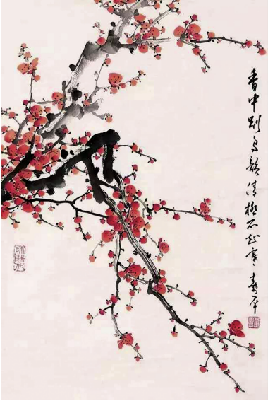
田世光（1916—1999），中央美院教授，张大千得意弟子，现当代工笔重彩花鸟画大师。

董寿平（1904—1997）当代著名写意画家、书法家。早年毕业于天津南开大学和北京东方大学。以画松、竹、梅、兰著称，晚年有黄山巨擘之称，以黄山为题材画山水，亦善书法。他笔下的朱砂红梅堪称绝技，在画界享有“董梅”、“寿平竹”、“黄山巨擘”的雅誉。